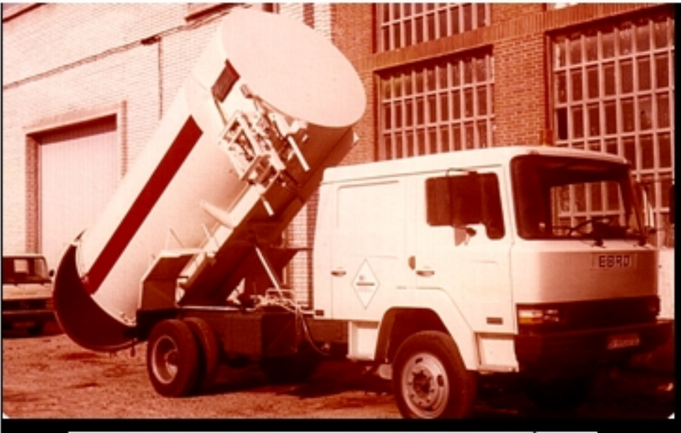
Detalle de unidad de recogida de residuos clínicos

Alimentación automática de la planta de tratamiento de residuos sólidos urbanos (RSU) en el municipio de San Juan de los Rios