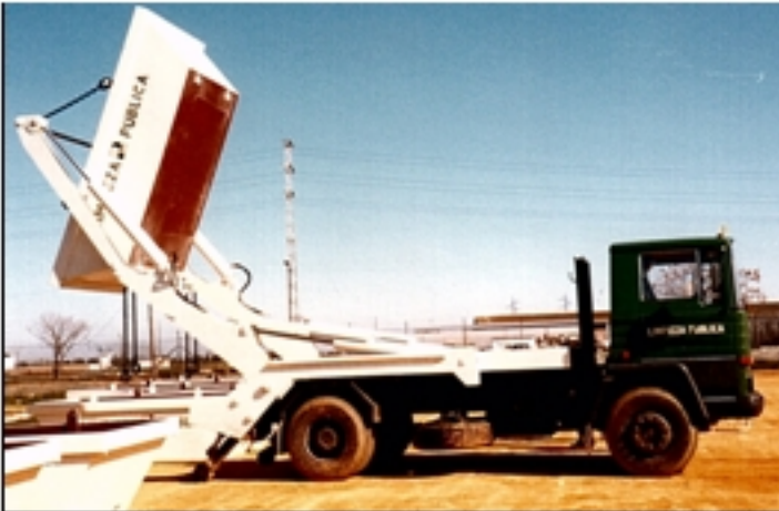
Detalle de elevador y contenedor