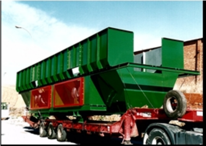
Reciclaje de residuos plásticos y de neumáticos. El reciclaje de neumáticos es la actividad más importante de la clasificación para facilitar su