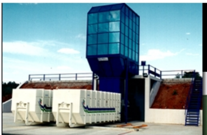
Vista Planta R.S.U. Campillo (Málaga)

Construcción de plantas R.S.U. de diferentes capacidades, realizando no sólo la fabricación y montaje de los diferentes equipos en calderería mecanizada (tolvas, cortavientos, compactadores hidráulicas, carros de traslación, contenedores, etc.), sino también toda la obra civil necesaria. En la actualidad, Talleres Mantecón, s.a. lleva el mantenimiento de algunas plantas de R.S.U.