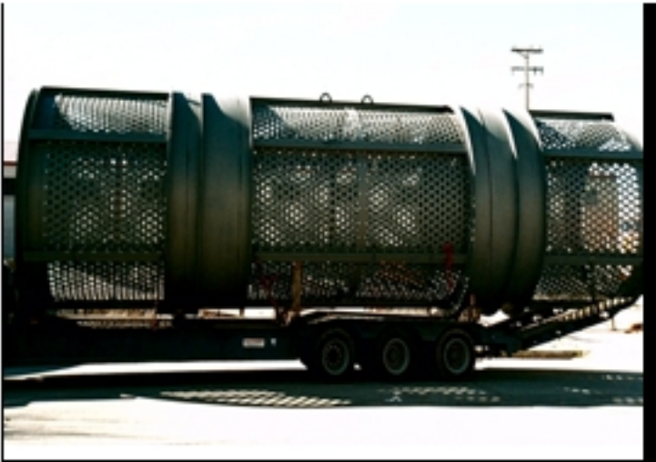
El reciclaje de neumáticos es una actividad importante en la separación de residuos. El reciclaje de neumáticos es posible en materia de reciclaje de