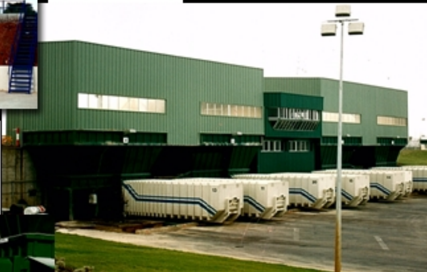
Vista Planta R.S.U. de Sevilla