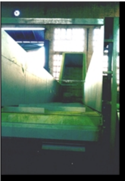
El reciclaje de residuos plásticos y de neumáticos es una actividad importante en la separación de residuos. El reciclaje de neumáticos es posible en materia de reciclaje de