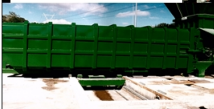
Detalle carro traslación y contenedor R.S.U